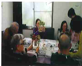
交流サロン (フラワーアレンジメント)