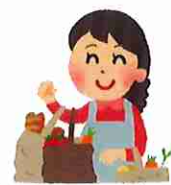
買い物・お手伝い