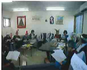
ふれあいルーム (クリスマス会)